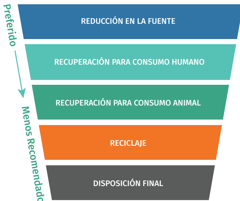
Gráfica 1. Sistema jerárquico de recuperación de alimentos

Optar por mantener la tendencia predominante actual —sin cambio alguno— conlleva ciertos riesgos: si una empresa continúa operando con los postulados intrínsecos sobre los niveles aceptables de residuos, corre el riesgo de quedarse atrás frente a competidores innovadores que obtienen ya una ganancia a partir de sus desechos. La justificación financiera —y ambiental— de la reducción de la PDA es sólida, y quienes ignoren esta oportunidad continuarán desperdiciando dinero y recursos. Además, cada vez son más los gobiernos locales, subnacionales y nacionales que imponen prohibiciones a la eliminación de alimentos desperdiciados o que exigen la donación de los excedentes (Sustainable America, 2017; Christian Science Monitor, 2018). De continuar esta tendencia, es probable que en el futuro las empresas enfrenten aún más gastos derivados de nuevas disposiciones reglamentarias en la materia.